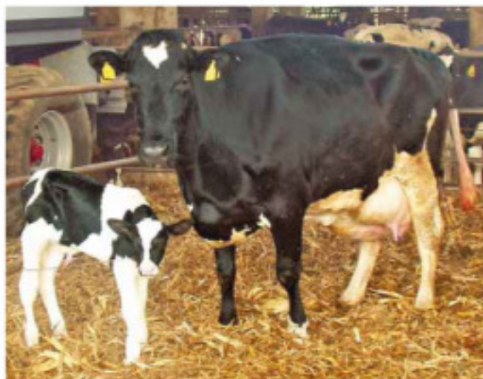
Concentrazioni di magnesio ematico inferiori a 1,6 mg/dL predispongono la vacca al parto a una maggiore suscettibilità all'ipocalcemia

Il problema in esame è stato ben evidenziato da uno studio epidemiologico condotto negli Usa nel 2002. Dopo aver analizzato la calcemia al parto di oltre 1.400 vacche, si è visto come il 25, 42 e 53% degli animali, rispettivamente in prima, seconda e terza lattazione e oltre, mostrassero un calcio al di sotto della normalità nelle ore immediatamente successive al parto. Va sottolineato che frequentemente incidenze ele-